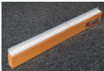
カーボン修正器 ●巾=295mm