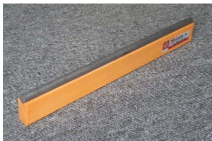
凹凸検知器・小 ●巾=295mm