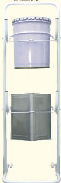
上段：ペール缶 下段：一斗缶