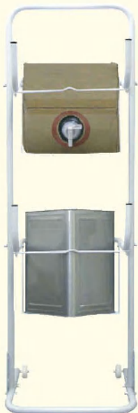
上段：キューブBOX 下段：一斗缶