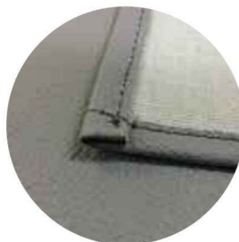
厚みのある素材を使用！