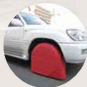
ランクルにも対応！！