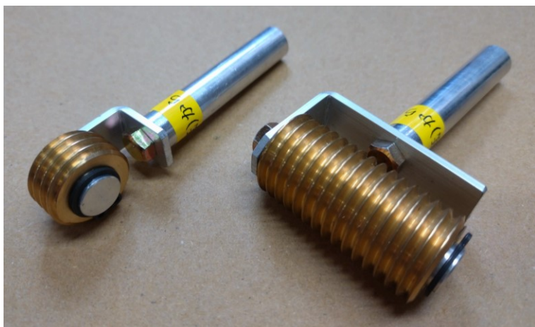
↑シボローラ・標準